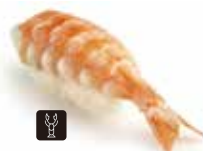
36 EBI gambero cotto* € 1,80