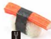
40 KANI surimi* € 1,60