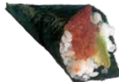
199 SPICY TUNA TEMAKI tonno piccante e avocado € 6,00 🐟