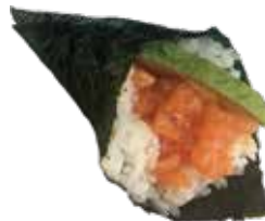
198 SPICY SAKE TEMAKI salmone piccante e avocado € 6,00 🐟