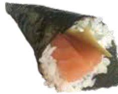
196 PHILADELPHIA TEMAKI salmone, avocado e philadelphia € 6,00 🐟 🥥