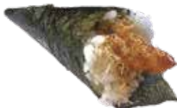
195 EBITEN TEMAKI gambero* fritto, salsa rosa e teriyaki € 6,00 🍣 🦀