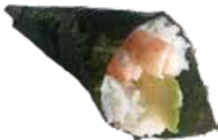
194 EBI TEMAKI gambero* cotto, avocado e philadelphia € 6,00 🦀 🥥