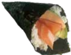
192 SAKE TEMAKI salmone, avocado e salsa rosa € 6,00 🐟