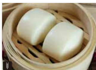
8 PANE AL VAPORE* € 4,00