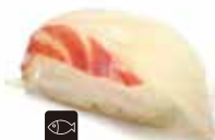
33 SUZUKI branzino € 1,80