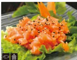
23 TARTARE DI SALMONE € 8,00 salmone, sesamo e salsa ponzu