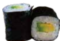
173 AVOCADO MAKI avocado € 4,00