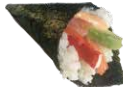
197 CALIFORNIA TEMAKI polpa di granchio*, avocado, salmone e salsa rosa € 6,00 🦀 🐟