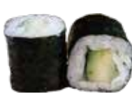
175 KAPPA MAKI cetriolo € 4,00