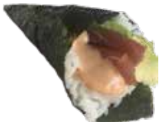
193 TEKKA TEMAKI tonno, avocado e salsa rosa € 6,00 🐟