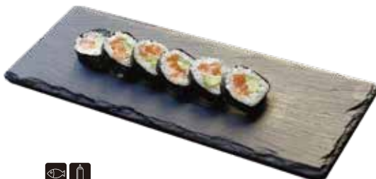
🐟 🥥 220 FUTO SALMONE € 7,00 salmone, avocado e philadelphia