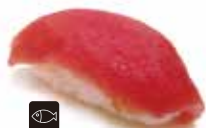
31 TEKKA tonno € 2,00