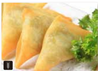
2 HARUMAKI CURRY 2pz involtini di verdure e curry* € 5,00