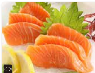
80 SALMONE € 8,80 6 filetti di salmone