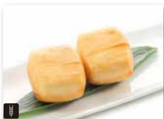
9 PANE FRITTO* € 4,00