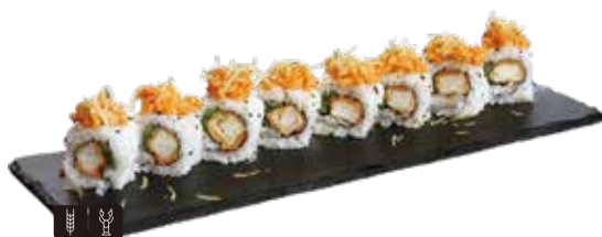
141 SURIMI ROLL € 12,00

gambero* fritto e salsa rosa con salmone, avocado e teriyaki all'esterno