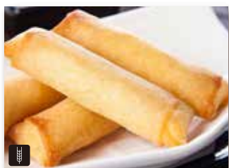
1 HARUMAKI 3pz involtini primavera* € 5,00