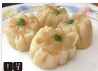
6 SHAOMAI 3pz gamberi e carne* € 6,00