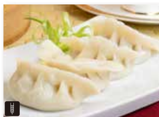
5 RAVIOLI DI CARNE 3pz carne di maiale* e verdure € 6,00