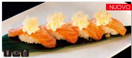
59 SUSHI MISTO 9 € 8,00 4 nighiri salmone scottato, philadelphia, pasta kataifi e teriyaki (ordinare solo una volta)