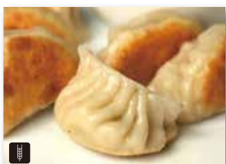
7 RAVIOLI ALLA GRIGLIA* € 6,00