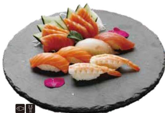
56 SUSHI MISTO 6 € 13,80 6 sashimi salmone e 6 nighiri misti