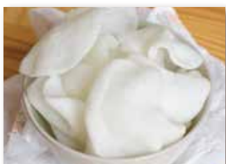
10 NUVOLE DI GAMBERI € 3,00