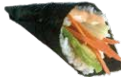
201 VEGETARIAN TEMAKI avocado, cetriolo, carote, insalata e salsa rosa € 5,00