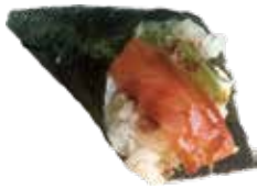
190 BEST TEMAKI salmone, philadelphia, avocado, crunchy e teriyaki € 6,00 🍣 🐟 🥥