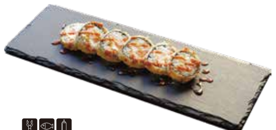
🦀 🐟 🥥 221 FUTO FRITTO 2 € 8,00 gambero* cotto, salmone, philadelphia, salsa teriyaki e piccante