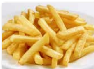
286 PATATINE FRITTE € 5,00