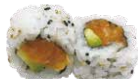
153 SPICY SALMON